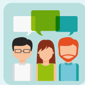
Понимание и использование рецептивной и экспрессивной речи